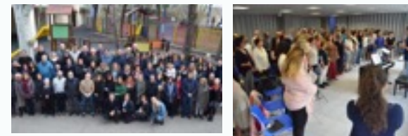
Cantate Mundi: la formación coral

Este proyecto ha reunido un grupo de personas con una cuidada formación musical y vocal, así como experiencia coral, personas implicadas en él y con un enorme compromiso de trabajo tanto particular como en conjunto. Pero sobre todo y por encima de todo, se trata de un grupo formado por personas con ganas de aprender y crecer musicalmente, algo que no hemos dejado de hacer en ningún momento.