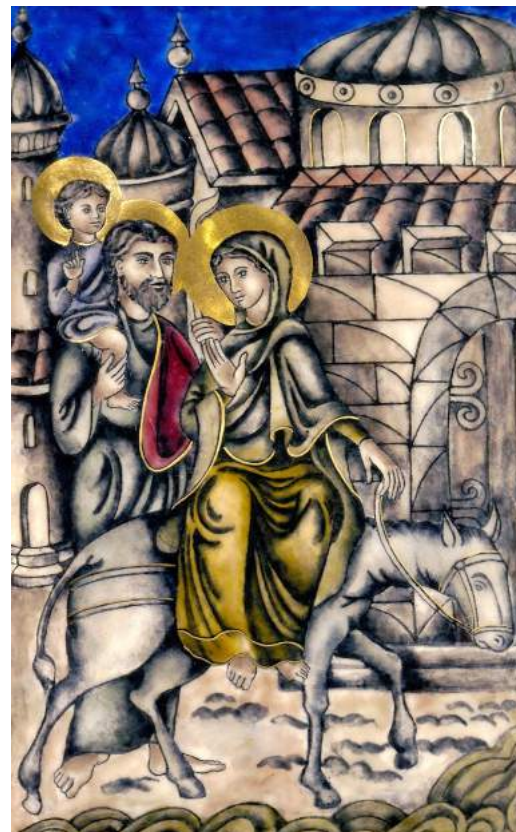
Nacimiento y Huida a Egipto Esmaltes de las puertas del Sagrario de la Basílica Virgen Milagrosa

“Y la Palabra se hizo carne, y acampó entre nosotros, y hemos contemplado su gloria...”